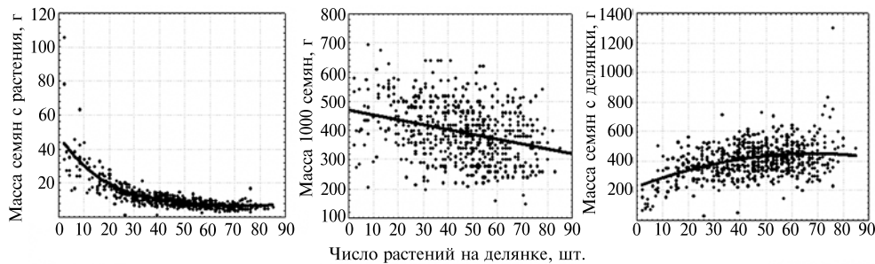
Рис. 1. Масса семян у образцов нута ( Cicer arietinum L.) из коллекции ВИР в зависимости от числа растений на делянке (кривые построены методом взвешенных наименьших квадратов; Тамбовская обл., 2011 год).

Число взошедших растений варьировало от 2 до 85 на делянку и в среднем составило 45. Все исследованные признаки, кроме продолжительности периода всходы—цветение, в той или иной степени зависели от числа растений на делянке (особенно при 2-30 растениях) (рис. 1). Сильнее всего с плотностью всходов была связана масса сухого растения: при числе растений менее и более 30 она в среднем составила соответственно 35,6 и 12,5 г. Масса семян с растения при тех же вариантах плотности всходов равнялась соответственно 21,6 и 8,7 г, аналогичным образом нелинейно менялось число бобов и семян на растении, а также число ветвей 2-го порядка. При густоте до 30 растений увеличение их числа на одно приводило к повышению массы семян с делянки в среднем на 8,6 г, при большей плотности соответствующий прирост составлял 1,6 г. Поражение фузариозом на делянках до 30 растений в среднем соответствовало 1 баллу, более 30 — 3 баллам, продолжительность вегетационного периода с ростом плотности посева слаболинейно уменьшалась (коэффициент корреляции r = -0,36 ), также уменьшалась высота растения ( r = -0,30 ) и масса 1000 семян ( r = -0,30 ).